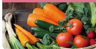
おいしい野菜づくりに！