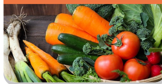
おいしい野菜づくりに！